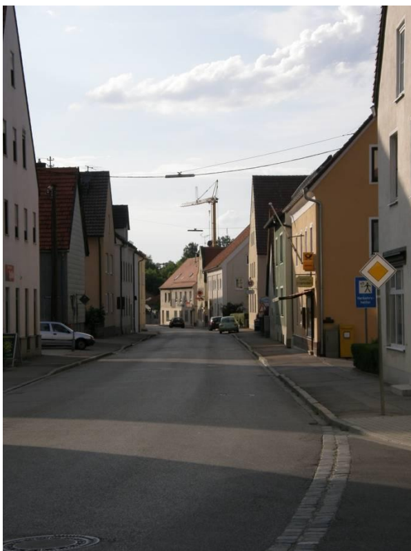
Aktueller Stand: Der triste Auer Ortskern

In Anbetracht der Tatsache, dass Au bald mit einer Ortsumgehung ausgestattet ist und somit durch den Ortskern weniger Verkehr fließen wird, stellt sich die JU Holledau vor, dass man den tristen und teilweise maroden „Ortskernschlauch“ umgestalten könnte. Am groben