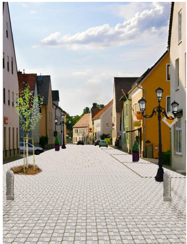
Nach der Umsetzung der JU Ideen. Au wird schöner.

Grünflächen und warmes Beleuchtungskonzept: Allee-Stil kombinierbar mit einem Beleuchtungskonzept von vielen kleineren Lampen als Ersatz für die großen Straßenlampen mit 70er-Jahre-Charme.